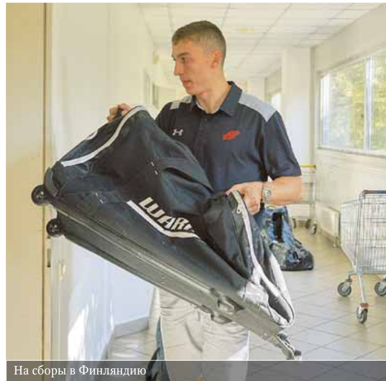
На сборы в Финляндию

– Да! Про это я и говорю, потому что многое зависит от тренера. Весь тренерский штаб – очень большая школа и очень большой бонус для нас. Здорово, что представился шанс поработать с таки-