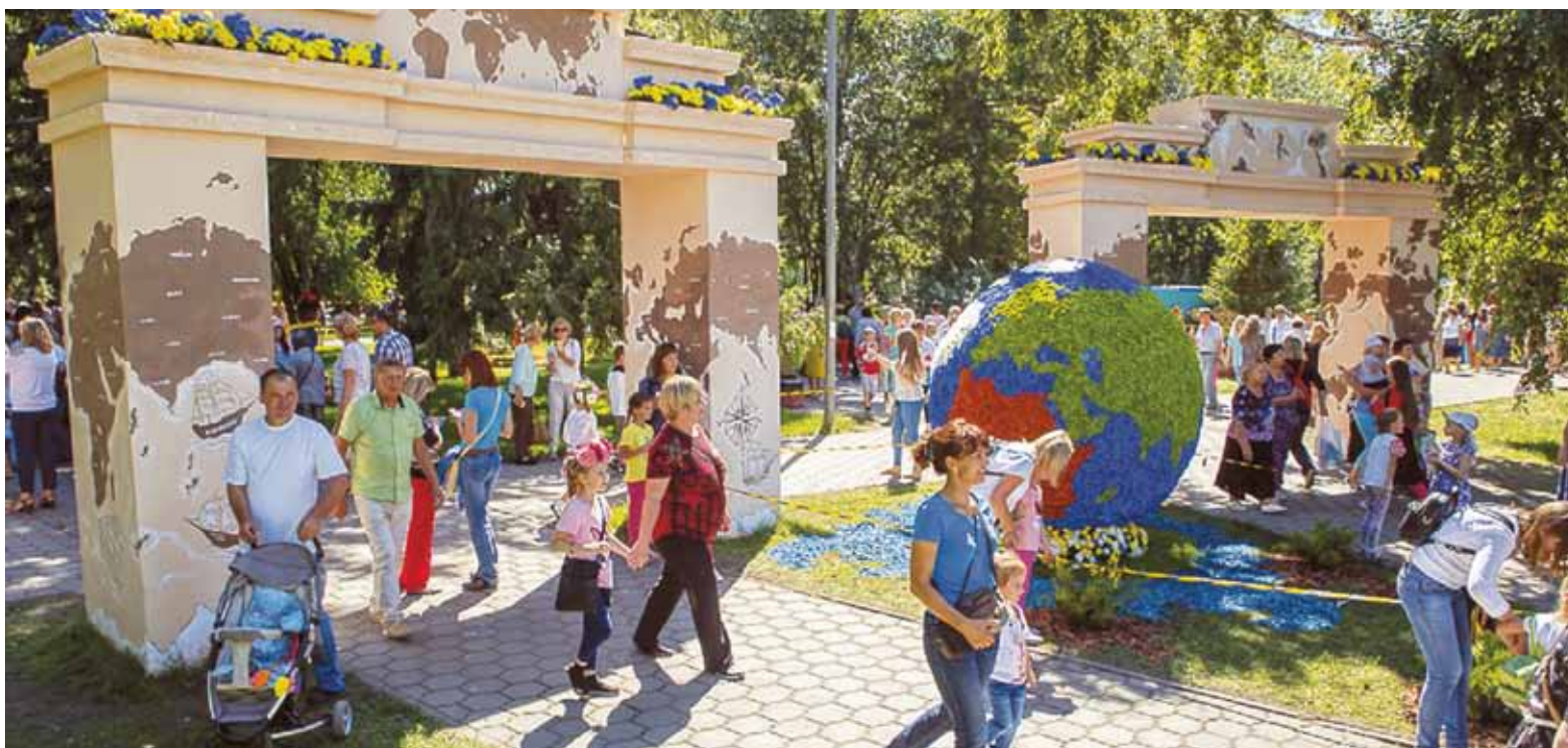
Именинник был как никогда наряжен. Особенно в местах проведения городской выставки зеленого строительства, цветоводства и садоводства «Флора». В праздничные дни ее посетили 300 тысяч человек

В минувшие выходные омичи и гости города поучаствовали в мероприятиях, посвященных 302-й годовщине со дня основания Омска. Программа праздника была составлена с учетом разных возрастов и вкусовых предпочтений. Одинаково высокий интерес имели авиашоу группы высшего пилотажа «Русь» и фестиваль национальных культур «Многонациональный Омск. Сердца, звучащие в унисон». Горячо любимая омичами выставка «Флора» привлекла, как всегда, сотни тысяч посетителей. Выставка-ярмарка омских мастеров, мастер-классы и игры от театров и библиотек, площадка силового экстрима, концерты симфонического оркестра, омских творческих коллективов, а также столичных звезд популярной эстрады – все эти события были многотысячными. Несмотря на «некруглую» дату, торжество имело размах, а любое, даже камерное, мероприятие проходило под знаком креатива и позитива. Некоторые яркие моменты праздника – в нашем фоторепортаже.