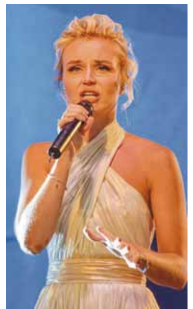
Концерты популярных групп «Градусы», «Серебро» и певицы Полины Гагариной стали наряду с салютом яркой кульминацией праздника