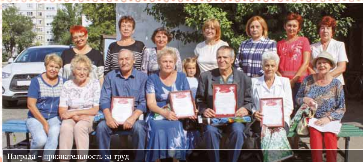
Награда – признательность за труд

Д ень города для управляющих компаний – прекрасный повод для подведения итогов работы в истекшие весенние и летние месяцы, а также планирования того, что еще будет необходимо сделать до наступления зимы. В управляющей компании «СемеркаСервис», ранее известной омичам под названием «Жилищник 7», такой возможностью пользуются каждый год. Не забывая отметить тех, кто вносит свой весомый вклад в обеспечение в домах уюта и комфорта, а именно наиболее активных представителей собственников – председателей домовых комитетов.