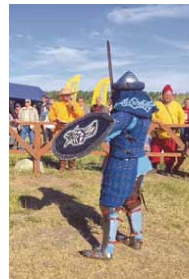
XIV военно-исторический фестиваль «Щит Сибири» объединил сотню профессионалов исторической реконструкции из Омска, Томска, Барнаула, Новосибирска, Красноярска, Тюмени и Астаны