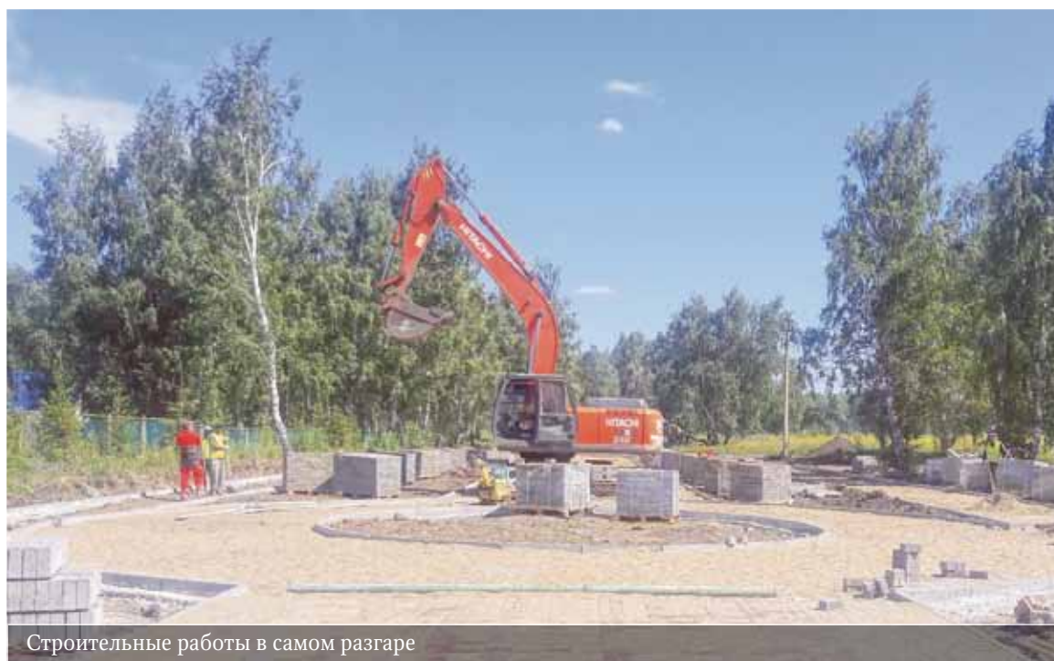
Строительные работы в самом разгаре

Омские депутаты проверили, как идут работы по созданию семейного парка