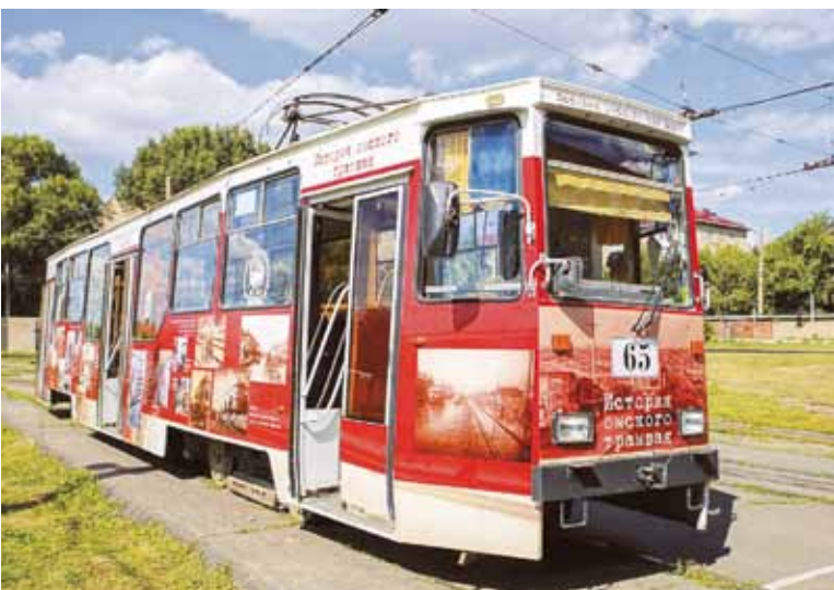
Накануне праздника сотрудники предприятия «Электрический транспорт» украсили трамваи. Иллюстрации повествуют об истории омского трамвая и лучших работниках, знакомят с представителями старейших трудовых династий