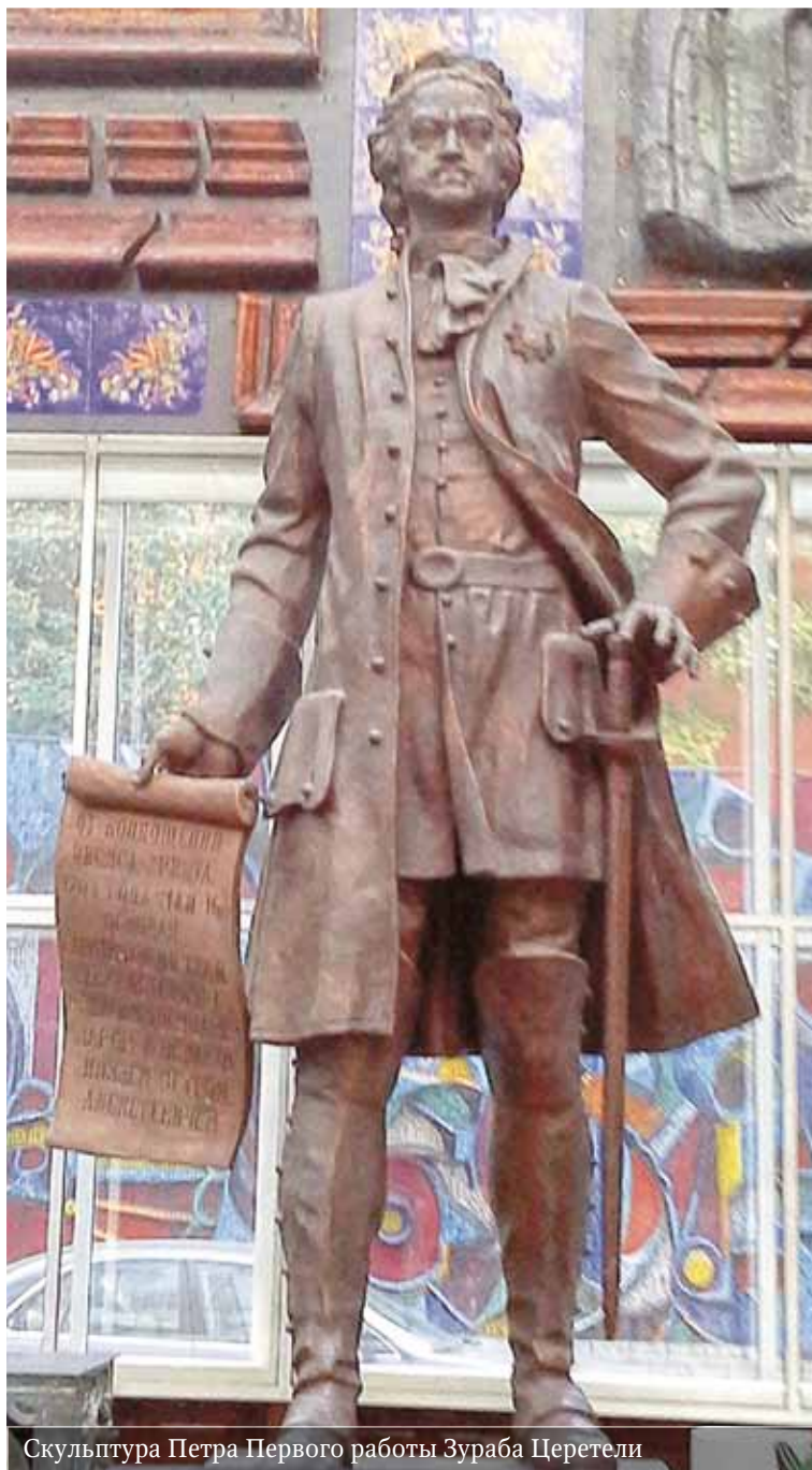
Скульптура Петра Первого работы Зураба Церетели

Что же изменилось за два года? Конечно, все жители нашего города заметили изменения, связанные с благоустройством Омска, а вот с сохранением исторической