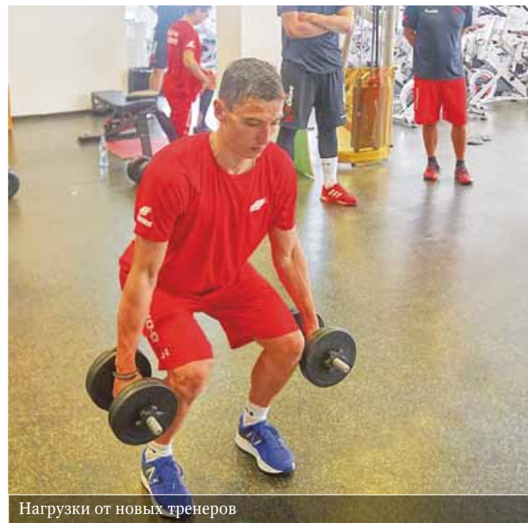
Нагрузки от новых тренеров