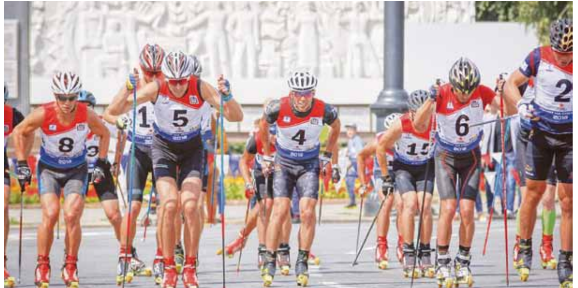
Праздник города по традиции – это еще и праздник спорта. Помимо бегунов за звание лучших боролись лыжероллеры