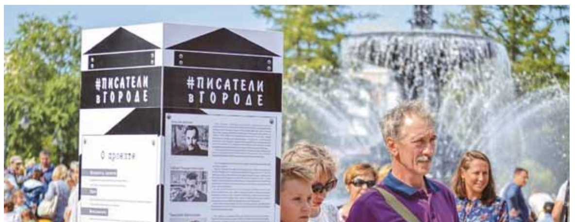
С гостями праздника проводили игры, посвященные истории Омска и известным омичам. День города – чем не повод узнать больше о людях, прославивших Прииртышье?