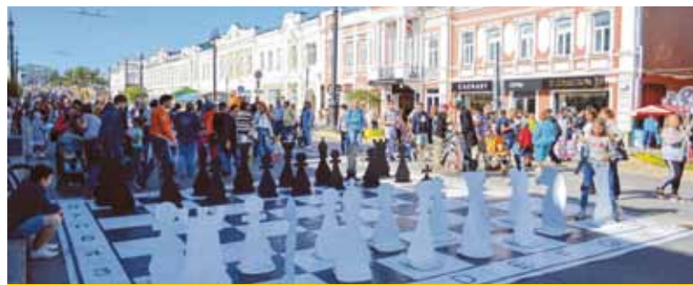
Любители интеллектуальных марафонов смогли сразиться в масштабном шахматном поединке