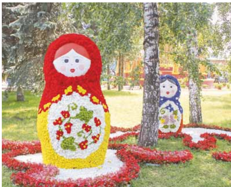
Гости «Флоры» в этом году смогли совершить путешествие вокруг света. Цветочные экспозиции объединили темы и мотивы, связанные со странами Европы, Азии и Африки. Но не меньшим спросом пользовались композиции, оформленные в русском народном стиле