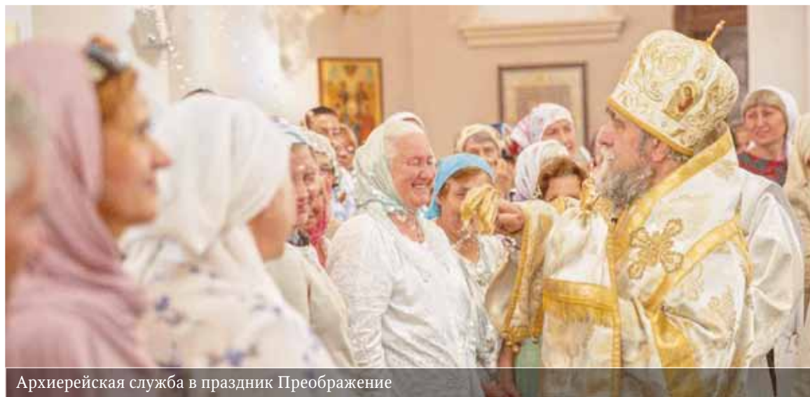
Архиерейская служба в праздник Преображение

Слово митрополита Омского и Таврического Владимира на праздник Преображения Господня