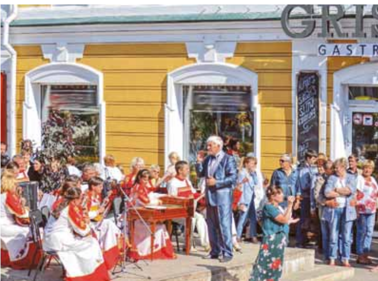
Концерты под открытым небом стали не просто доброй традицией, но и местом притяжения омичей. Русский камерный оркестр «Лад» – один из любимых коллективов