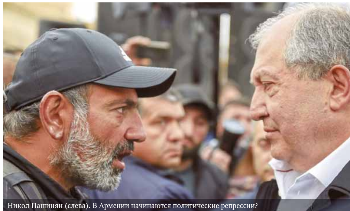
Никол Пашинян (слева). В Армении начинаются политические репрессии?

«ДГ» представляет обзор событий последних семи дней в рубрике «На злобу недели»