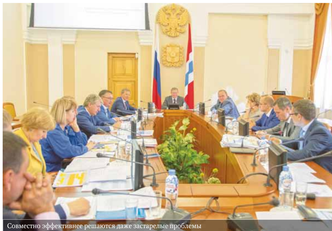
Совместно эффективнее решаются даже застарелые проблемы

«Экзамен» для глав: районы представили Александру Буркову проекты развития территорий