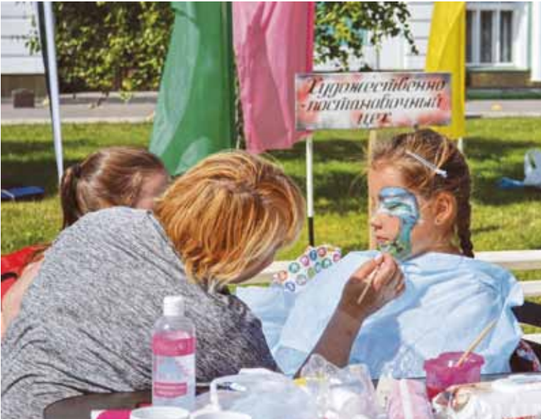
Возле Драмтеатра развернулся художественный цех. Оформители омских театров преображали к празднику юных омичей

– Все мы хотим, чтобы Омск был комфортным городом для проживания. И сегодня мы видим, как много делается для развития городской инфраструктуры: обустраиваются парки и скверы, ремонтируются дороги, приводятся в порядок дворы. Желаю всем омичам доброго здоровья, благополучия, успехов в реализации намеченных планов. А родному Омску – процветания и уверенного движения вперед!