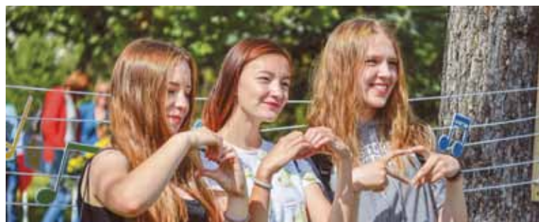
Горожане не стеснялись признаваться в любви к родному городу. Они – главные герои праздника