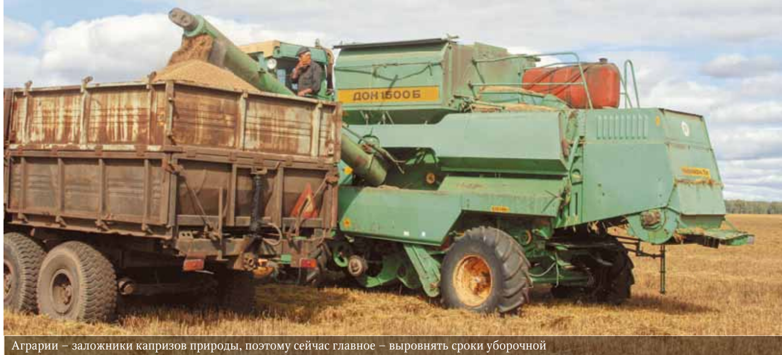
Аграрии – заложники капризов природы, поэтому сейчас главное – выровнять сроки уборочной

составлял более 60 тысяч гектаров, то сегодня обмолот составит лишь около 4 тысяч гектаров (0,3% от общей площади). Это колоссальное отставание.