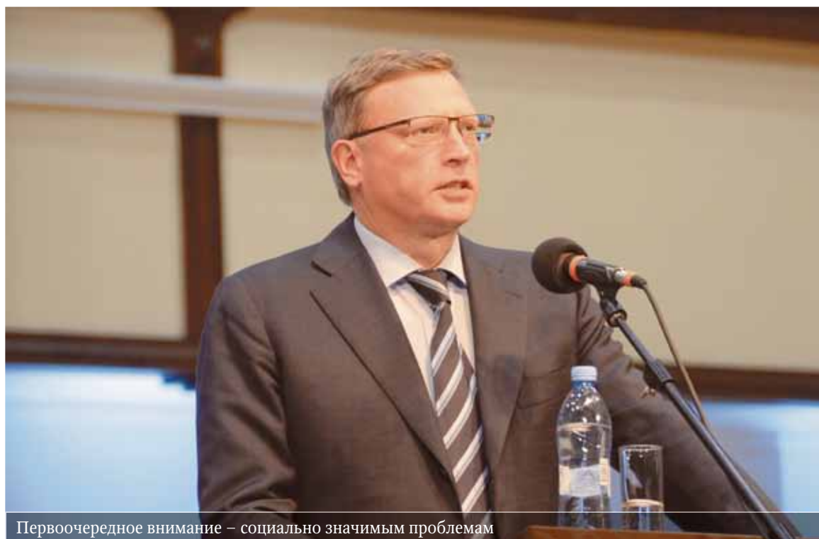
Первоочередное внимание – социально значимым проблемам