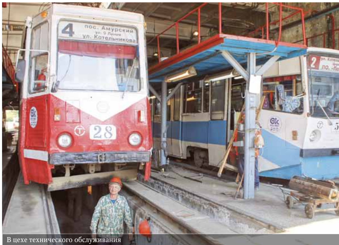
В цехе технического обслуживания

Кто и как приводит в движение городские трамваи?