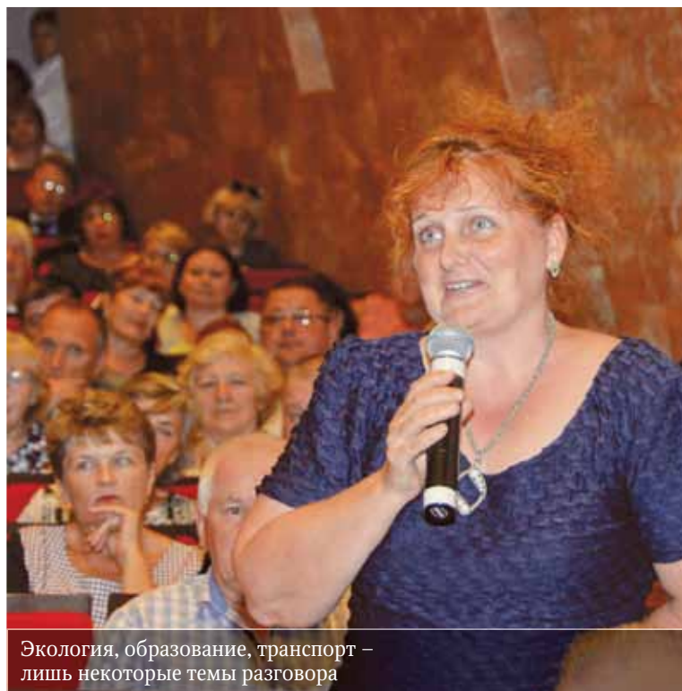
Экология, образование, транспорт – лишь некоторые темы разговора

чае, это необходимо. Я с вами полностью согласен, население должно знать своих чиновников в лицо», – отметил руководитель области.